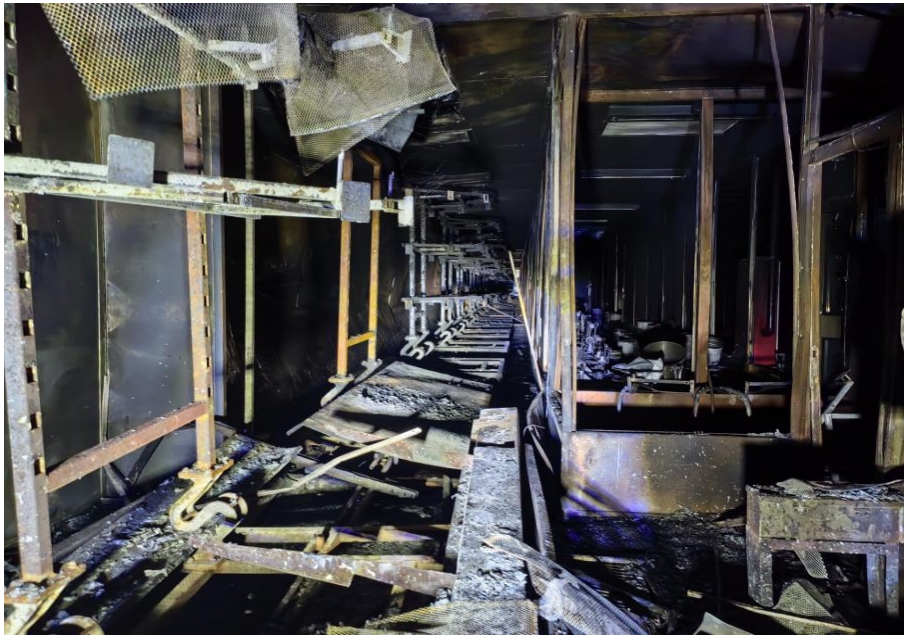
图 2 事发后喷漆车间实景图