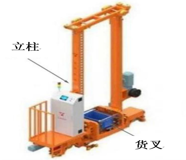
图 2 堆垛机示意图